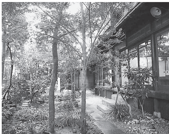
緑と石畳の中庭。街なかとは思えない静けさを感じられる