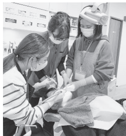
バキューム実習の参加者ら =4月1日、大阪市内