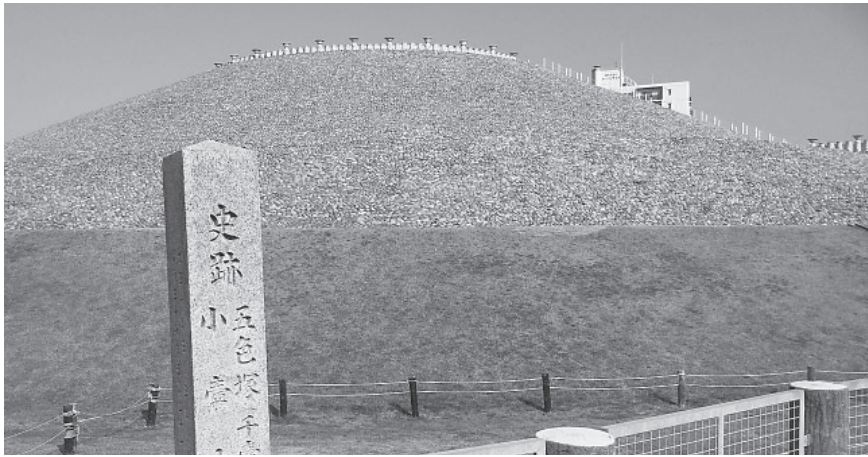
海辺の住宅街にある巨大な五色塚古墳。全長194mを誇り、千壺古墳とも呼ばれている

(一面からつづき) この手法ならカードで証明できる資格等は、政府が示している各種カードの範囲を超えた拡大も容易でしょう。もちろん法改正等が必要ですが、関心を持つ国民が少なければ、いつの間にか拡大されてしまうかも知れません。 カードで、あなたのことが全てわかる時代が想像してみてください。ある日、あなたは街頭で警察官から職務質問を受け、カードを出すように言われます。カードを警察官の持つタブレットにかざすとあなたの持つ資格情報や職業、収入、病歴、犯歴などの個人情報——あなた自身がもう忘れていた過去の出来事に関する個人情報も含まれているかも——が画面にずらりと並びます。安全・安心な社会のためには必要だと思われるかも知れませんが、こうした未来がやって来る可能性があることに留意しておく必要があるでしょう。 また、政府は民間企業にも電子証明書の利用を促していますから、カードで引き出せる個人情報には、行政機関保有のものに限られなくなるでしょう。電子証明書をスマホに搭載する準備も進められています。果たしてどんな未来が待ち受けているのでしょうか。