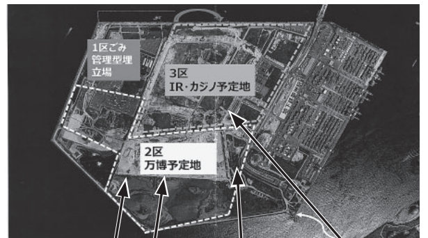
写真1 夢洲航空写真(2021年9月撮影)

土壌対策で財政破綻も 夢洲開発の始まりは2006〜2015年にわたる「大阪市総合計画」です。「新たな都市活力創出拠点として」(略) 咲洲・舞洲・夢洲を、港湾・物流機能と、集客・観光の場、臨海部における都市魅力の向上を図る」としています。2008年以降、大阪府庁舎のWTCビル移転を手段に、都構想の目玉として夢洲開発を推進、さらに2016年、府市一体で万博・IR・カジノ誘致計画を強行しました。