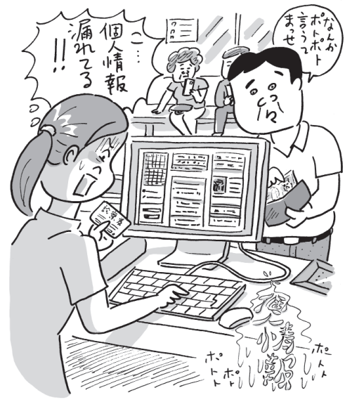
イラスト・辻井タカヒロ

また医療機関は、取り扱う個人情報の漏洩、滅失、毀損の防止その他の個人情報の安全管理のため様々な措置を講じなければなりません。具体的には個人情報保護に関する規程の整備・公表、個人情報保護の推進のための組織体制等の整備等です。