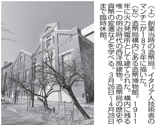
(上)創業当時の造幣局。イタリヤ人技術者のマンチニが1873年に描いた。(左)造幣局構内にある造幣博物館。1911年に火力発電所として建てられた。構内に残る唯一の明治時代の西洋風建物。造幣局の歴史や貨幣の変遷などを学べる。3月26日〜4月28日まで臨時休館。

義務付ける日本初の職場ともなった。職員には、維新前後に失職した元武士が多かったよう、断髪には抵抗感を示した。写真をとられる際、ずいぶん確率で、彼らが断髪を隠すための帽子をかぶっている。