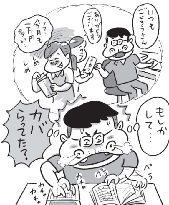
イラスト・辻井タカヒロ

給与が過払いになっていくことに気づくことがあります。この場合に、請求できるかどうかですが、正当な理由がなく利益を受けることを「不当利益」といい、民法では、このような不当利益を受けた者に対して返還する義務を負うことを規定しています。当然です。時期においてなされることであらかじめ労働者にそのことが予告されると