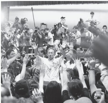
基地建設反対を掲げ、過去最高の得票数で初当選した玉城デニー氏

翁長雄志知事の急逝に伴う沖縄県知事選挙が9月30日に投票され、「オール沖縄」が支援する玉城デニー氏が、安倍政権が全面的に支援した佐喜真淳氏を破り、初当選した。