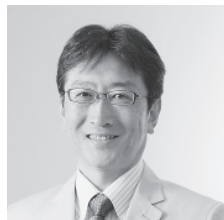
大阪大学歯学研究科長・歯学部 予防歯科学教授