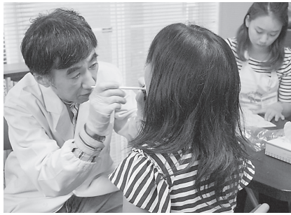
子ども食堂での健診の様子

「子ども食堂」歯科健診 子どもの貧困問題を背景に「子ども食堂」が各地で広がるなか、協会は同食堂での歯科健診や歯みがき指導に取り組んでいる。健診を通じて、様々な困難を抱える子どもの実態や現場の苦悩が見えてきた。