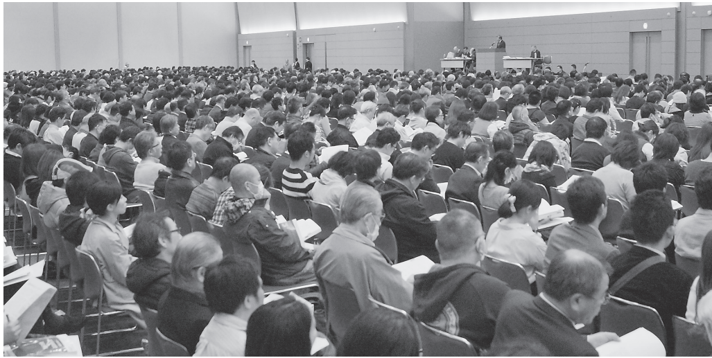
1750人が参加した前回の新点数中央説明会