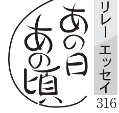
リレー エッセイ 316