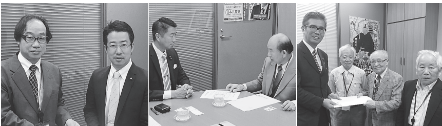
右から宮本議員、清水議員、堀内議員、9月28日、東京・国会議員会館

「保険でよい歯科医療を大阪連絡会」は9月28日、国会要請に取り組み、地元選出議員を中心に患者負担引き下げや次期改定へ向けて歯科診療報酬改善などを要請した。