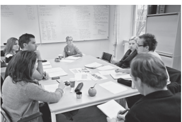
少人数グループでの問題解決型学習法を採用しているマルメモデル

00年頃からは、反対に歯科医師不足が問題になり始めた。当時のマルメ大学歯学部学部長が、「歯科医師不足は深刻な問題になっていく」とザ・クインテッセンス誌に寄稿した