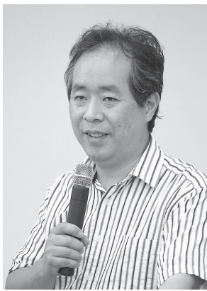
習熟者の確認、生活歴、社会歴、現病歴、家庭状況など、重要なポイントが6月18日、M&Dホールの研修で解説された。

「腫瘍のように命に関わるもの、命に関わらないが通常の歯科処置では治癒しないものや、診断を誤りやすいもの」を指摘。扁平上皮癌は力リフラワー状を呈し、硬結する典型的な症状を示すが、中胚葉系の腫瘍は深部に存在するため腫脹を主に認めるなどの例をあげ、症例を紹介。それぞの症例について、参加者との質疑応答を挟みながら、重大疾患の見分け方を解説した。