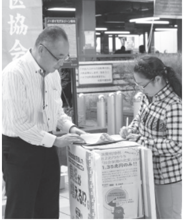
制度の見直しに反対し署名を訴えるひとたち＝大阪市

12/5 2016年第1253号 （毎月5、15、25日発行） 敬 会 協 医 保 險 科 歯 府 大 阪 市 浪 速 区 幸 町 1-2-33 大 阪 市 浪 速 区 幸 町 1-2-33 電 話 (06) 6568-7731 (代 表) http://osk-net.org/ ● 定 価 ・ 年 間 10,000 円 月 1,000 円 ● 1977 年 5 月 23 日 第 三 種 郵 便 物 認 可