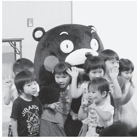
くまモンのステージ=1日、マイドームおおさか

大阪府保険医協同組合は第39回保険医まつりを1日・2日、マイドームおおさか(大阪市中央区)で開催し、歯科・医科各協会から会員や家族、従業員など、のべ2860人が参加した。