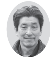
文・絵 藤田 進 (河内長野市)

昨年、私は282本の映画を見ました。で、その中の1本を選ばず「チヤイルド44」。この映画、冒頭から終わりまで緊張感が続き、それに謎解き加わる。ぜひ、見てください。