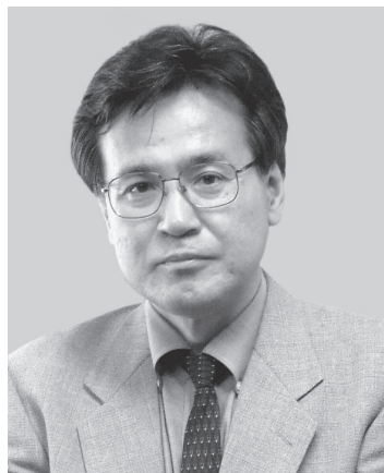
大阪保険医協同組合理事長