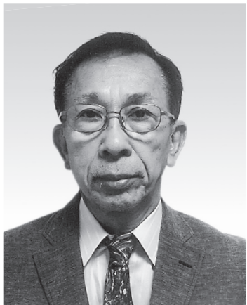
大阪歯科技工士連絡会代表

除医協同組合では組合員の医院経営に少しでも貢献できるように安価で良質の医薬品・医療材料を中心にさまざまな商品、サービス、各種保険等の提供を心がけるとともに、新しい事業にも展開してまいりました。 昨年10月3日、4日にマイドーム大阪で開催しました第38回協同組合まつりには約2750人の来場者がありました。イベントステージでは、3日「BORO」、4日「テツアンドモ」が出演、イベント広場には多くの来場者が集まりました。 とくに「テツアンドモ」の時間は子ども連れのご家族が多く、過去最高の観客数となりました。復活した企画として子ども様向けに縁日コーナーを設け、チケット数では約570枚利用されました。今後も会場アンケートの結果を踏まえ、さらに充実した企画を検討してまいります。 大阪府保険医協同組合は本年も消費税増税・TPP参加・税と社会保障の一体改革に反対する活動を医科協会・歯科協会とともに一層進めるとともに、「安心・信頼・満足を届けたい」保険医協同組合です」を合言葉に、府民の健康と開業医の「経営を守る」事業をさらに発展させていく所存です。 組合員の先生方のご指導ご鞭撻をお願いし、新年のご挨拶にかえさせていただきます。今年もよろしくお願ひ申し上げます。