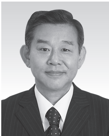
大阪府歯科保険医協会理事長