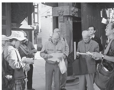
天満界隈を散策した大阪府南部地区の文化企画

天満宮の西には川崎東照宮の碑があった。東照宮は日光が有名だが、江戸時代、徳川家康への忠誠心を広げるために全国に100カ所以上建てられたという。扇町公園では、扇の意味を解説。淀川が大阪湾まで人工的に延ばされ、天満堀川は物資運搬のために開削されるなど、長い歴史が「扇」を形作ったと西俣氏。池上雪枝が作った「感化院」の全国的な広がりや、大塩平八郎の乱の後、大阪が誇らしく思えるような文化企画だった。