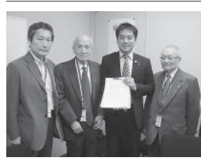
辰巳議員(右から2人目)

司、(民主)尾立源幸、(維新)東徹、(公明)石川博崇、杉久武、山本香苗、(共産)辰巳孝太郎 (敬称略・順不同) 10・23国会行動要請議員 (面談) 衆院(維新)遠藤敬、参院(共産)辰巳孝太郎、(秘書対応) 衆院(自民)とかしきなおみ、北川知克、中山泰秀、大塚高司、左藤章、原田憲治、(民主)辻元清美、(維新)井上英孝、浦野靖人、松浪健太、遠藤敬、馬場伸幸、林原由佳、足立康史、上西小百合、木下智彦、谷畑孝、三宅博、村上政俊、西野弘一、丸山穂高、伊東信久、(公明)北側一雄、佐藤茂樹、伊佐進一、國重徹、浮島智子、樋口尚也、(生活)村上史好、(共産)宮本岳志、(無所属)西村眞悟、参院(共産)山下芳生、(自民)太田房江、北川イッセイ、柳本卓司、(民主)尾立源幸、(維新)東徹、(公明)石川博崇、杉久武、山本香苗 (敬称略・順不同)