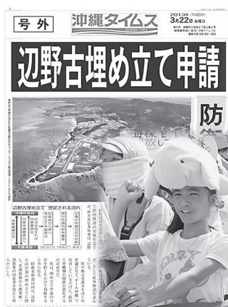
沖縄・辺野古新基地建設に対し、保守・革新の立場を超えた反対運動が続いている

した沖縄へ補助金投入は、決して地元経済を潤したわけではない。どのような財政補助を施された