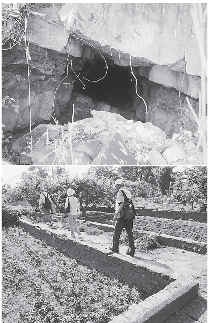
強制労働によって掘られた謎の地下壕(上)、畑の中にしっかりしたレンガ積みの敷石が残っている朝鮮人の宿舍跡(下)

日中全面戦争への突入で海軍から艦船の大幅な建造を求められていた川崎造船(1939年川崎重工と改称)は、42年に大阪府多奈川村と深日村(現在の岬町)に工場建設を決定。海軍はドック