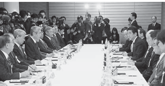
安全保障の法的基盤の再構築に関する懇談会（安保法制懇）＝2月4日、首相官邸

安倍政権の集団的自衛権行使容認論は、憲法9条の独自性を失わせ、日本を「普通の国」にレベルダウンしてしまっている。このように、国民の議論を抜きに行うことは到底許されない。