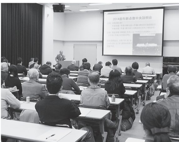
診療報酬改定と沖縄米軍基地問題を通して医療・平和を考えた会員学習会=9日、M&Dホール

米軍基地の辺野古移設問 題などについて考えた。 8日は市民公開講座と して、「基地が阻む平和 経済、医療・普天間基地 問題と私たち」の演題で