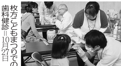
枚方子どもまつりでの歯科健診11月27日

当日は、「保険でよい歯科医療の実現を求める」請願署名に取り組み、120筆の協力を得た。