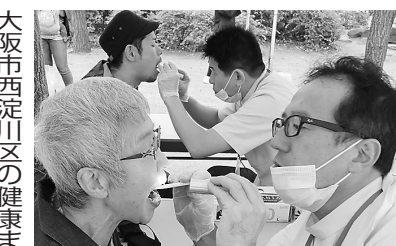
大阪市西淀川区の健康まつり会場での歯科健診11月20日

大阪市西部地区は10月20日、御幣島東公園(西淀川区)で開かれた西淀川・淀川健康友の会(淀川勤労者厚生協会)主催の「第14回健康まつり」で歯科健診を実施。一日中雨が降り冷え込む悪天候のなか、小・中学生や幼児連れれの若い夫婦、お年