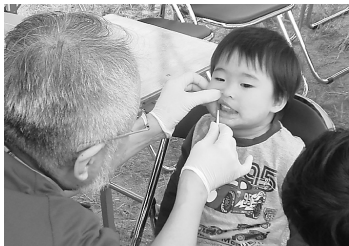
八尾市民まつりでの歯科健診11月3日

東大阪・八尾・柏原地区は9月22日から11月4日にかけて、医療生協かわち野の八尾クリニック・楠根診療所の各健康まつりと、東大阪・八尾の各市民まつり会場で4回の歯科健診を実施した。のべ328人(子ども160人・大人168人)が受診した。 各歯科医師は、親子や