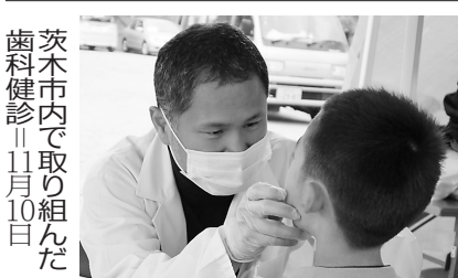
茨木市内で取り組んだ歯科健診11月10日