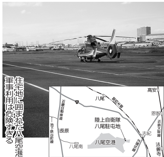
住宅地に囲まれた八尾空港 軍事利用は危険すぎる

「異常がなくて安心した」 事業所で健診・健康講話 健康講話では「パンフレット」よりよく食べるは「よりよく生きる」をもちに、噛むことの重要性を解説した。また、昨今話題のサプリメントの副作用についてもふれ、サプリメントと薬は相互作用があり、組み合わせによっては危険を伴うことがあることから「サプリメントをとるなら、投薬がないことが最低条件」と警鐘をならした。