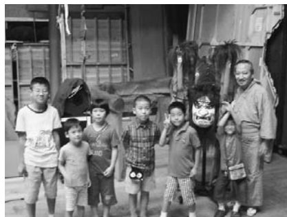
舞台裏で解説を受けた子どもたちと桐竹勘十郎氏(右端)