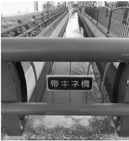
長瀬川に架かる「帝キネ橋」が帝国キネマ長瀬撮影所跡を物語る

しかし、過剰な設備投資の影響やライバルである日活や松竹の現代劇の映画制作が関東大震災から復興し、洗練された作品を送り出すようになった。30年2月には厳しい検閲をかいくぐり完成した