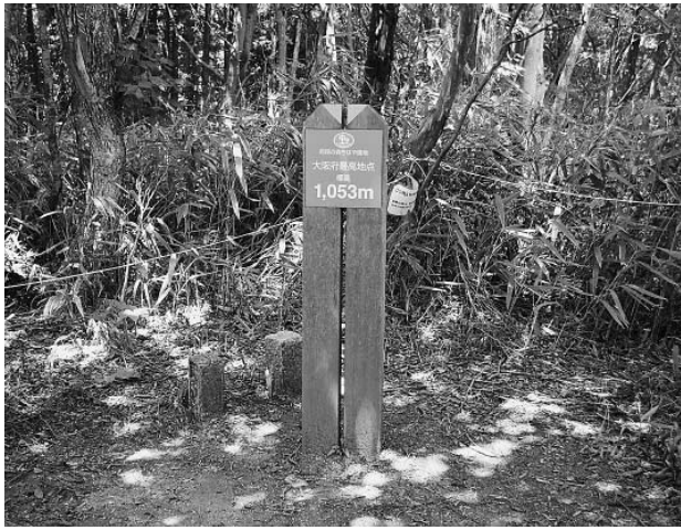
大阪府最高地点を示す案内板