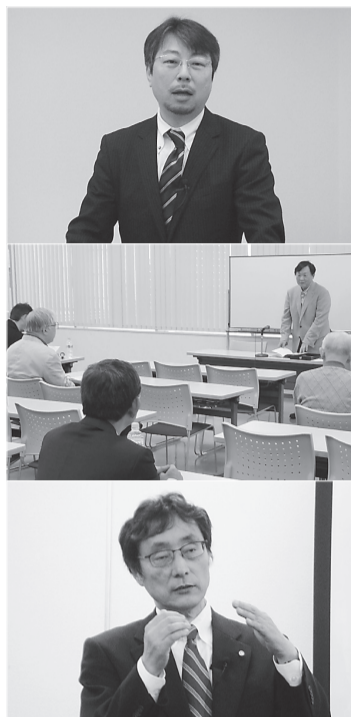
各地区総会記念講演。上から、大阪市4地区(3月10日)、三島地区(3月10日)、南河内地区(3月23日)、北河内地区(3月23日)、堺・高石・和泉地区(3月30日)、東大阪・八尾・柏原地区(3月30日)