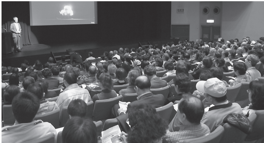
950人の参加者が詰めかけた「原発と憲法9条を考える市民公開講演会」

大阪府歯科保険医協会 敬 発行人 志岐 敬 大阪市浪速区幸町1-2-33 電話(06)6568-7731(代表) http://osk-net.org/ ●定価・年間10,000円 月1,000円 ●1977年5月23日第三種郵便物認可