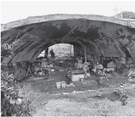
傷みが進む掩体壕の保存が望まれる

基、飛行場周辺にも20基以上の掩体壕があったという。垣内の掩体壕はもと幅28尺、奥行き21尺で、1943年ごろ、陸軍の屠龍(二式複座戦闘機)や飛龍(四式重爆撃機)の大型機を格納できるように造られたが、実際にはここに飛行機の部品などが置かれていた。飛行場からの誘導路は幅員が5〜6尺、延長4・5キロの砂利道で、馬