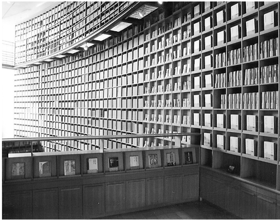
天井に達する6万冊に及ぶ蔵書類

初めて降りた近鉄奈良 初老の女性が「どこへ行く線が「八戸ノ里」駅の構内です」と聞いてくれた。私の行き先を、買い物を手にしたと、予期してたかのよう