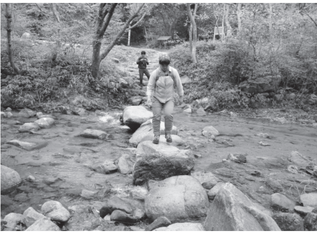
渡渉を楽しめる六甲のハイキングコース

第三に、実施機関（保健センター）が医療受診の有無や科目を判断するというが、医療の専門性や公共性についての認識が欠けているといえる。西成区に特別の施策を行おうとするものであるが、いずれは、全市のに、全府的にやられることが危惧される。こうした登録制度はともないうことだし、やめさせるべきである。