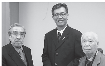
宮本岳志議員 (共産)

面談に応じたのは、辻恵(民主)・松岡広隆(民主)・吉井英勝(共産)・宮本岳志(共産)各衆院議員。辻恵議員は、西成の生活保護登録問題について、橋下大阪市長は、誰も手をつけないところ