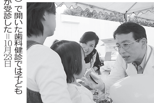
寝屋川市(上)と枚方市(下)で開いた歯科健診では子どもからお年寄りまで250人超が受診した = 10月23日