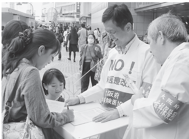
東京・新宿駅前の街頭宣伝で署名を集める協会役員(右) = 10月30日

基調報告で保団連の宇佐美宏樹代表は、保団連の受診実態調査結果にもとづき、経済的理由での受診中断が半数を超える実態などを指摘し、次期改定では診療報酬の大幅引き上げや保険給付の拡大が必要と強調。「保険で良い歯科医療を求め」請願署名や地方議会での意見書採択の運動を推進しようとした。