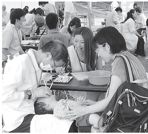
多くの市民が受診した9月18日、吹田市千里南公園

協会の北大阪地区は、9月18日、吹田市千里南公園で開かれた第29回吹田「よっこいで祭り」で無料歯科健診に取り組み、市民730人が受診した。歯科医師10人と衛生士15人が出務した。同祭りで健診は今年で10回目。