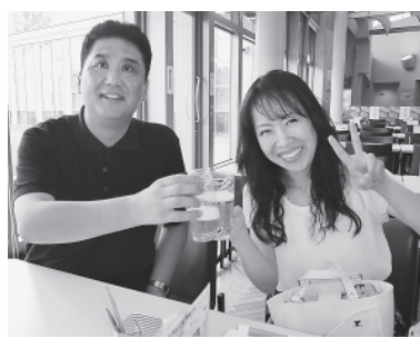
無料試飲ビールで乾杯する参加者=9月4日、吹田アサヒビール工場

北大阪と三島地区は9月4日、文化企画「アサヒビール吹田工場見学会」を主催した。会員と家族ら22人が参加した。