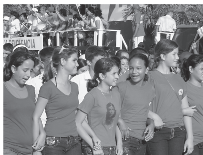
メーデーに参加する中高生。彼女らも防災に貢献している

会員がい航した者は、以後米国内国禁止だったことがある。そのような時代錯誤の規制がいまも通用している。 東日本大震災後の医療支援に参加し、急性ストレス障害に悩んだ小生は特にキューバの防災に関心を持っていた。同国の憲法には防災の条項がある。 「革命防衛委員会」の果たす役割のためである。ハリケーン発生の際にカリブ海諸島のなかで、キューバでの死者が極めて少ないのも「市民防災委員会」の貢献による。防災について、日本はキューバに学ぶことが多いと痛感した。