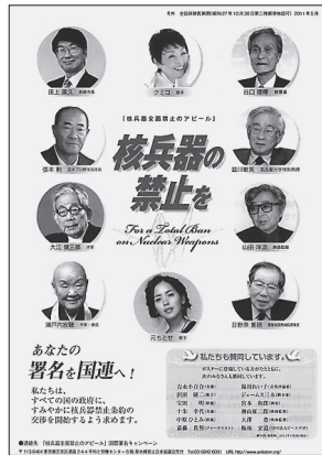
アピールには、大江健三郎、瀬戸内寂聴氏が賛同を表明。

運動と世論が世界中で大きく盛り上がっている。昨年5月の核不拡散条約(NPT)再検討会議では「核兵器のない平和で安全な世界」を実現するための最終文書が採択された。ICAN(核兵器廃絶国際キャンペーン)は、核兵器禁止条約(核兵器の製造、実験、保有、使用の禁止と廃絶)を国際的論議の主流に据えるための具体的な動きかけを世界的な規模で取り組んでいる。昨年12月の第65回国連総会でも、多くの国が核兵器廃絶の実行を求め、この条約の交渉開始を求める決議には、133カ国が賛成したが、日本はこの決議に棄権した。 私たちは、唯一の被爆国政府に対し、米国の「核の傘」から脱却して「核兵器禁止条約の交渉の開始」に積極的に関わるように働きかけたい。医療従事者をはじめ、ご家族、多くの患者・市民・友人などにICAN