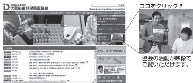
協会の活動が映像でご覧いただけます。