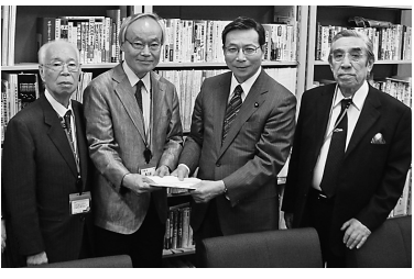
吉井英勝議員 (共産)