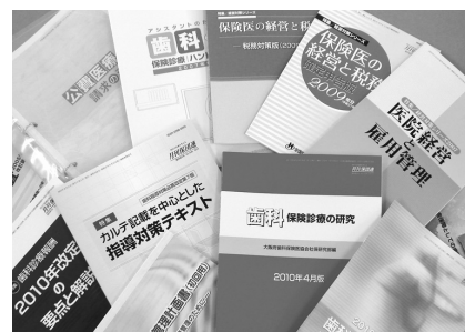
入会時には、診療に役立つ書籍を進呈します