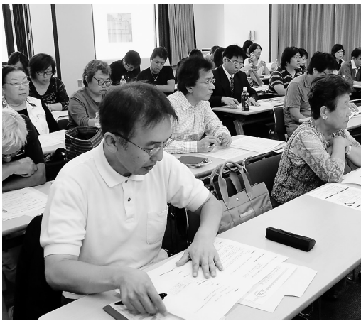
賃金計算の方法を学ぶ参加者=3日、保険医会館

賃金計算の端数処理では、1カ月単位での1時間未満の切り捨て・切り上げはできるが、1日単位ではできない。割増賃金の不払いには、16カ月以下の懲役または30万円以下の罰金」が科せられる。この罰則には続き