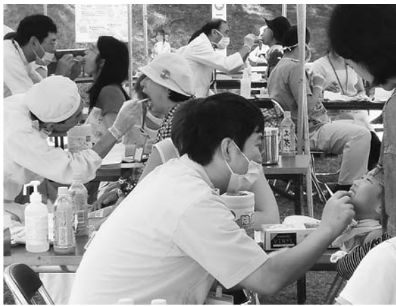
家族連れで受診する姿が目立った吹田「よっとい でまつり」での歯科健診＝9月19日、千里南公園

「あまり受診していな い」の声をよく聞かれま す。理由は「そんなに痛 くないから大丈夫」とい うものもありますが、最 も多いのは「窓口での負 担が高いから」という声 です。多くの方が無料歯 科健診のように「気軽に 受診できたら」と話して います。