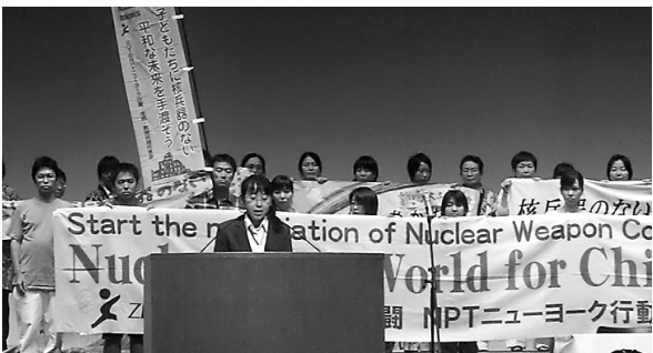
原水爆禁止世界大会で「核兵器のない世界を」と訴える参加者＝8月6日、広島市

核兵器のない世界を指すためには、「核抑止論」「核の傘」そのものから脱却が必須で、改めて政府に根本的な政策転換を迫らなければならぬ。世界大会を契機