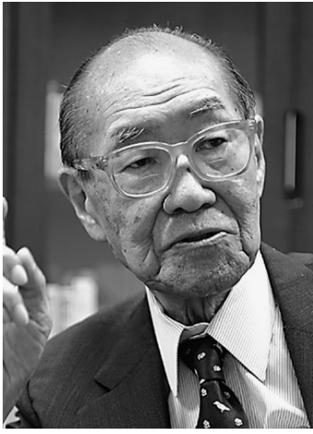
1924年生まれ。日本火災海上社長などを経て、国際開発センター会長。自身の戦争体験を通じ、護憲を訴えている。

戦争放棄をうたう憲法九条は、国家の利益ではなく人間の観点から、平和を希求しています。経済や外交についても、人間の目で見る必要があるのではないのでしょうか。08年のリーマンショックに象徴される市場原理