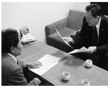
服部良一衆院議員(社民・右)