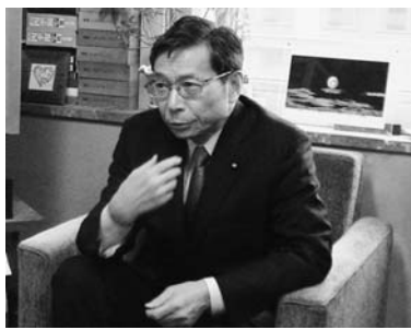
吉井英勝衆院議員(共産)