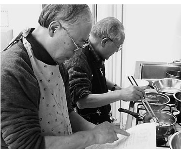
レシピを見ながら調理する参加者ら＝1月23日、大阪市内

経税部は、「弥生会計を使った決算準備」をテーマに1月23日、パソコン記帳講座を開き15人が参加した。 この講習会は、歯科医院が気軽に取り組める簡易記帳講座の第3弾として企画。昨年10月に開いた2日間の「はじめての弥生会計」に続き、一人一台のパソコンを使い3時間じっくりと会計ソフト習得に取り組んだ。 「決算準備」では、①基金・国保連合会からの月遅れ振込金の処理方法と年間総収入、必要経