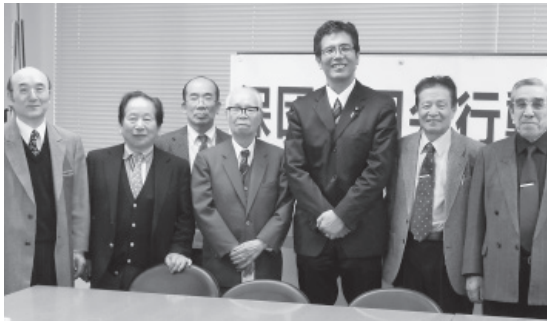
宮本岳志衆院議員(共産)

2/5 2010年第1033号 (毎月5、15、25日発行) 大阪府歯科保険医協会 会誌 発行人 志岐 敬 大阪府浪速区幸町1-2-33 電話(06)6568-7731(代表) http://osk-net.org/ ●定価・年間10,000円 月1,000円 ●1977年5月23日第三種郵便物認可