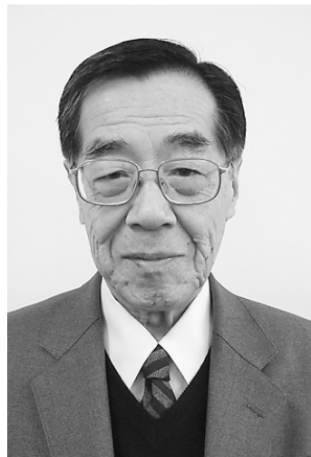
大阪府保険医協同組合理事長